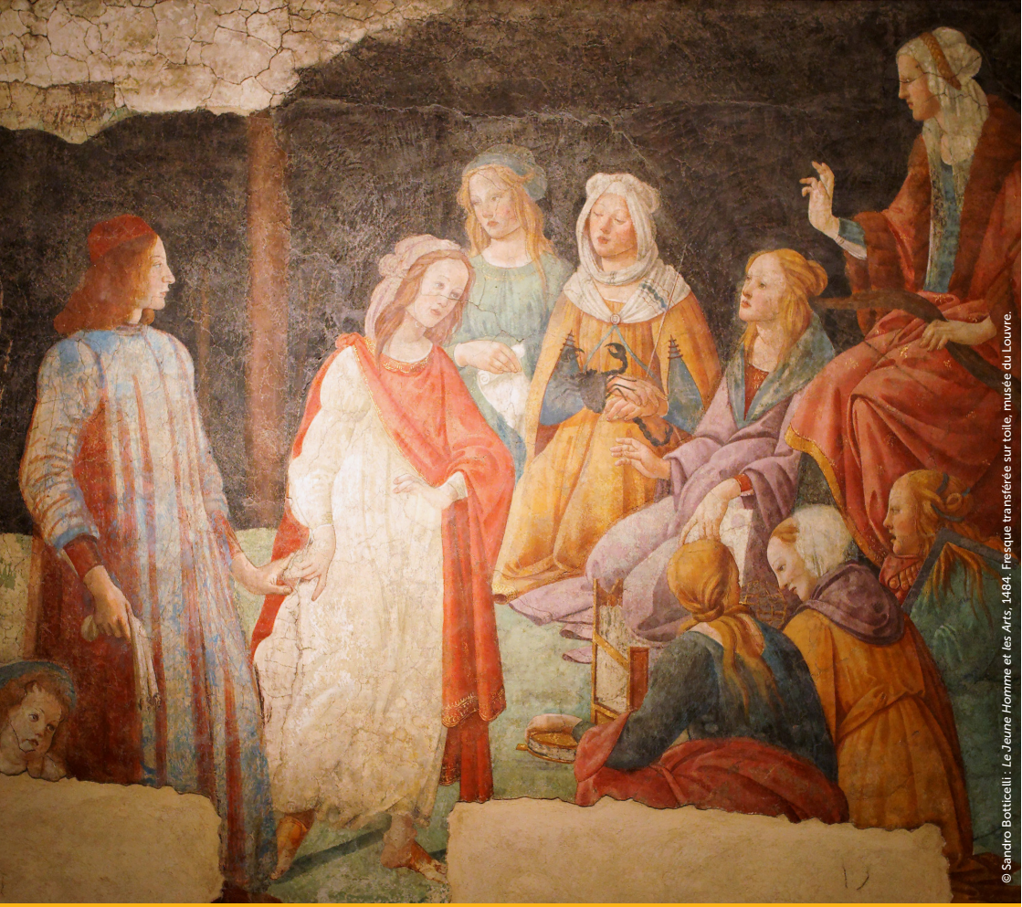
© Sandro Botticelli : Le Jeune Homme et les Arts, 1484. Fresque transférée sur toile, musée du Louvre.

Journée d'étude organisée par Alice Lamy, Anne Raffarin et Emilie Séris